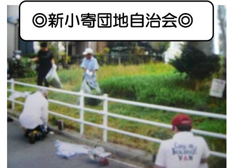
◎新小寄団地自治会◎