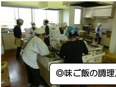
◎味ご飯の調理及び配付準備◎

10月24日（木）に一人暮らしの高齢者の方、約120名の方に味ご飯の配食を行いました。当日は早朝より、民生児童委員、老人会及び地域のボランティアの方々にお世話をいただきまして、誠にありがとうございました。当日の様子は下記のとおりです。