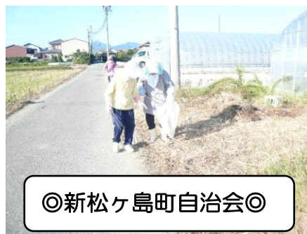
◎新松ヶ島町自治会◎