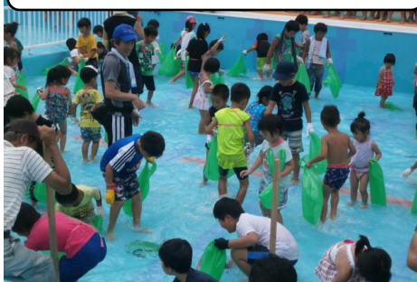
◎うなぎつかみ(こどもの部) ◎