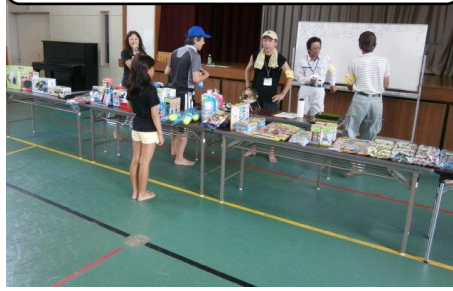
◎ビンゴゲーム大会◎