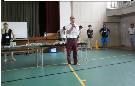
◎ 開会式会長挨拶 ◎