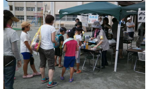
◎バザー（かき氷販売など）◎