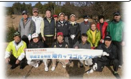
◆ラウンド前の集合写真◆