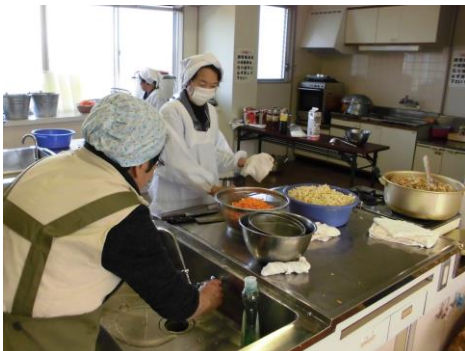
◎味ご飯の調理の様子です。

3月11日（金）に一人暮らしの高齢者の方、137名の方に味ご飯の配食を行いました。当日は早朝より、民生児童委員、老人会及び地域のボランティアの方々にお世話をいただきまして、誠にありがとうございました。