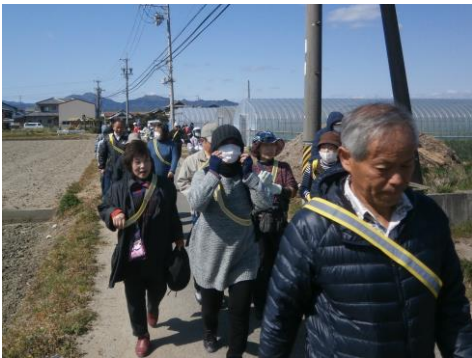
最年少参加、2歳の女の子も！

3月26日（土）、港まちづくり協議会では初めてとなるウォーキング大会を開催しました。参加された41名の皆さんは、松阪市健康推進課の方の指導のもと、正しいウォーキングについて学び、約2.4kmのコースを歩いていただきました。また、体組成計や、握力などが測定できる「健康チェックコーナー」も設置し、自身のからだについて見直していただきました。