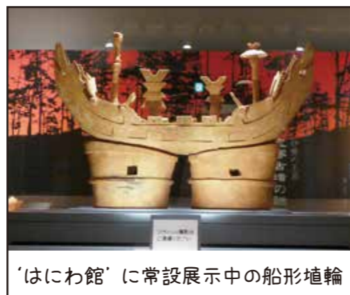
‘はにわ館’に常設展示中の船形埴輪

レプリカ（複製品）ではない本物の船形埴輪は、‘東京国立博物館’や‘大阪歴史博物館’、‘藤井寺市立生涯学習センターアイセル シュラ ホール’、長野県の‘飯田市考古資料館’などと共に、松阪市文化財センターの‘はにわ館’でも見ることができます。しかも‘はにわ館’で常設展示されているものは「船形埴輪の中では、日本一大きく、唯一立体的な飾りをもつ」