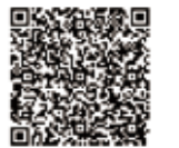
バーコード読み取り (文化財センター情報)

4 月の休館日は 3 日（月）、10 日（月）、17 日（月）、24 日（月）です。 開館時間は 9:00～17:00 です。