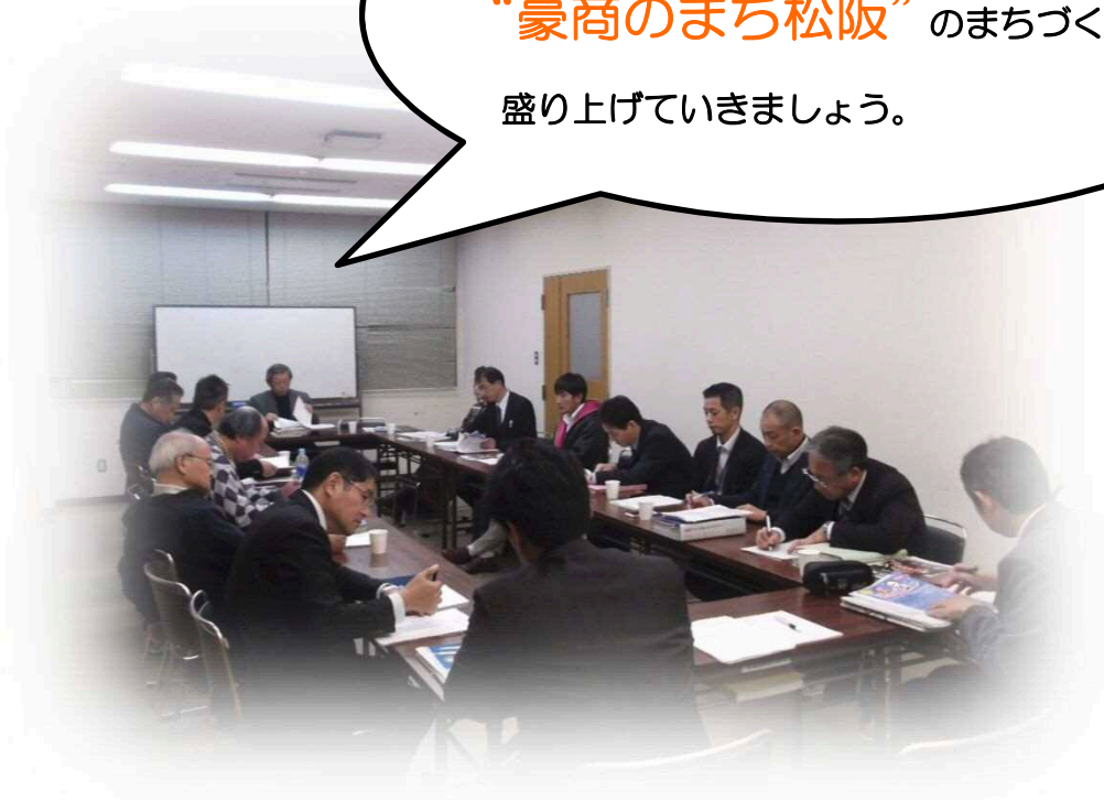
写真：松阪活き生きプラン推進委員会 会議の様子

市民のみなさんと一緒に “豪商のまち松阪”のまちづくりを 盛り上げていきましょう。