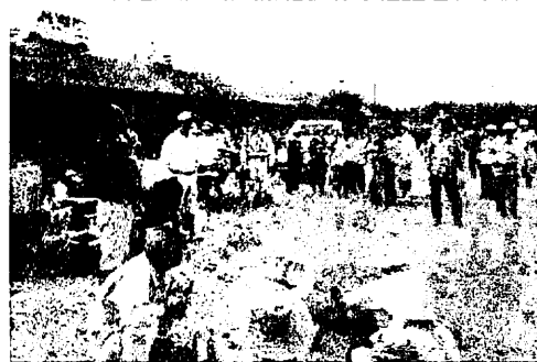
さつまいもの苗植付け

5月27日と31日農業振興部会と腹太環境保全チームが協力し機殿幼稚園、小学校の児童及び部員が、腹太町地内の畑に芋の苗を植えました。秋の収穫祭がたのしみです