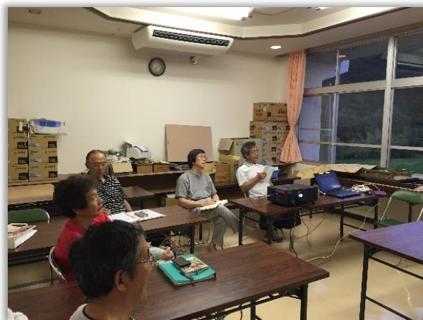
フェイスブック活用研修会の様

部会では、発信力と発信する情報や地域の魅力を少しでも広げていくことで、ホームページの作成につながる事ができればと期待しています。皆さんで、地域の良さをPRしてください。