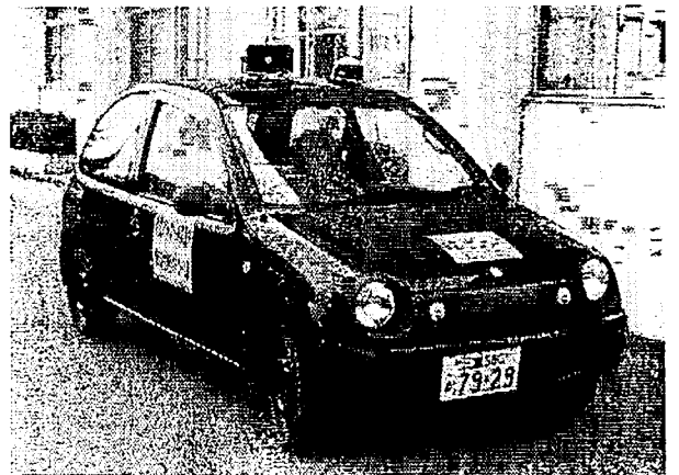
青色回転灯とスピーカーを設置した掃水自主防犯パトロール車

榑田地区市民センター1階の一室に掃水まちづくり協議会事務局の看板を設置しました。