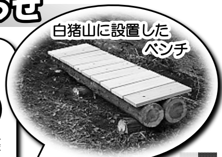
白猪山に設置したベンチ

【世代間交流会議】 2月5日(日)、地域の歴史や文化を題材に、世代を超えた交流会議を開催します。本年度は「松電(松阪電気鉄道)」をテーマに「講演と意見交換会」を行います。詳細は別ページで紹介します。