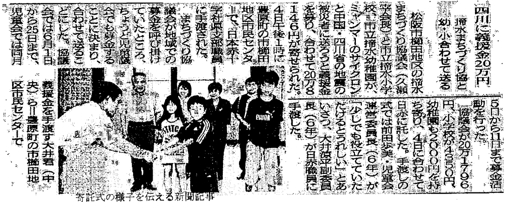
新聞記事を伝えるの様子を寄託

とです。国の内外を問わず、困った人がいれば手を差し伸べることは大変大切なことだと思います。自治会の方には忙しい中にもかかわらずわざわざ一軒ずつ回って集めることをお願いしました。また、地域が一つになってこのようなことができたのはすばらしいと思います。ありがとうございました。