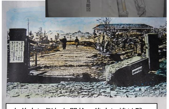
右前方に倒れた門柱、後方に焼け残った校舎が見られる