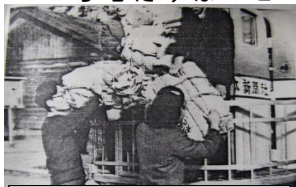
全国から寄せられた救援物資

燃える事件があり、しばらくの間、松阪の人々は大変不安な日々を過ごすことになりました。次の日十八日には新聞にも大きく取り上げられ、全国からたくさんのお食べ物や、毛布、学用品等が寄せられました。