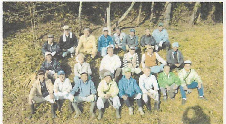
昨年の『草刈り十字軍』の様子

まちづくり協議会では、運動公園の草刈りをして 活動資金に充てたいと思っています。 手伝っていただける方は市民センターまでご連絡 ください。 草刈り機等は、無くても結構です。 作業のしやすい服装でご参加ください。 実施の有無は当日市民センターの留守番電話で確認 してください。