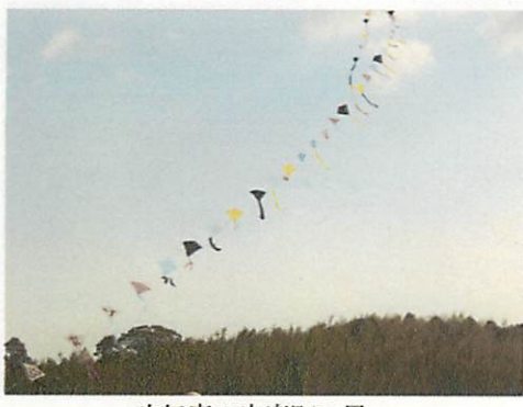
昨年度の安楽町の凧

・日時 平成24年1月6日(日) 悪天候の場合1月13日(日) ・集合 9時30分〜昼ごろまで ・場所 天王山総合運動公園