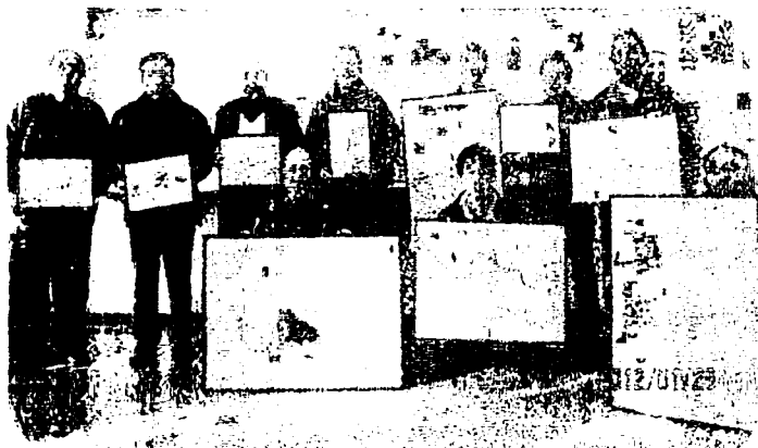
中原地区全体と各自治会別の2種類の地図を作りました。