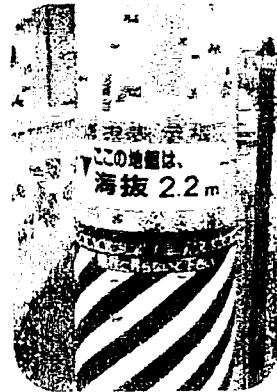
表示板の高さは関係ありません。 地盤の海拔表示です。