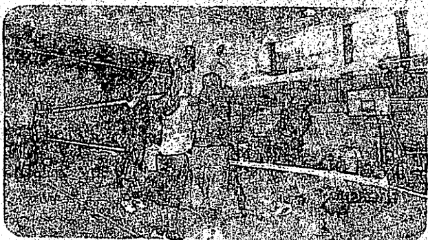
見事なアタックが決まりました!

6月17日(日)、まちづくり協議会体育部会主催による「第8回中原地区バレーボール大会」が行われました。参加いただいたチームは、男子の部が8チーム、女子の部が9チームで、トーナメント戦により、優勝を目指しての熱戦が繰り広げられました。会場である中原小学校体育館では、スパイクを決めるかけ声や、自分たちの自治会チームを応援する声援などが飛び交い、熱気に包まれました。「久しぶりに体を動かして、いい汗をかき、地区の皆さんと顔を合わせて楽しかったわ」と、感想をいただきました。選手の皆さん、応援いただいた皆さん、ご苦労さまでした。