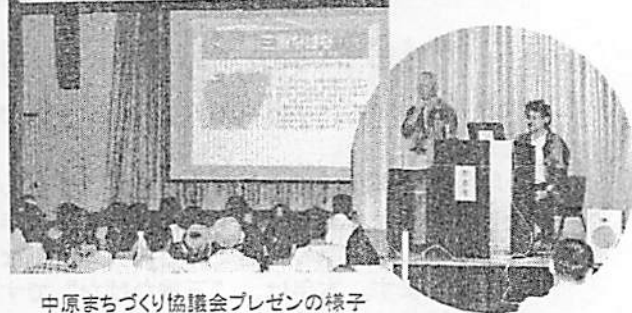
中原まちづくり協議会プレゼンの様子