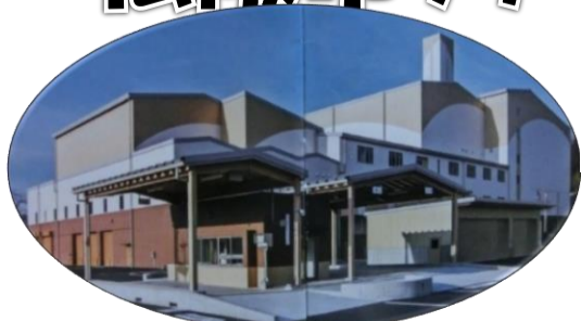
松阪市グリーンセンター (桂瀬町)