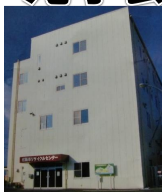
松阪市リサイクルセンター (町平尾町)