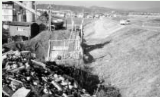
これでよいのか「堤防管理」

問 コンクリートのリサイクル施設として、雲出川の大正橋付近で操業されているが、堤防の