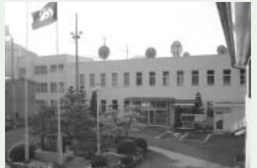
希望の持てる地域振興局に

答 振興局、本庁合わせて松阪市役所という考えで、市民サービスの向上を念頭に、簡素で効率的、市民ニーズや社会の要請にスピーディーに対応できる組織というものを目指し、柔軟に見直していきたいと考えている。