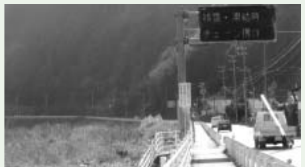
冠水で通行どめになった国道（飯南町）

答 ダムの洪水調整の理想の姿としては、流入量に対して調整総量をフルに活用して、安全に水量を調整するということが一番肝要であると考えているが、豪雨時における適切なダムの管