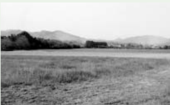
広大な県畜産研究部の牧草地（嬉野町）

答 ヒブノス嬉野の周辺整備は一連の計画と財政状況も見合わせる中で、新市建設計画の中にある長期的な視野に立った運営を行うとしており、今後検討していく必要があると考える。意見 県への折衝に鋭意ご努力願いたい。