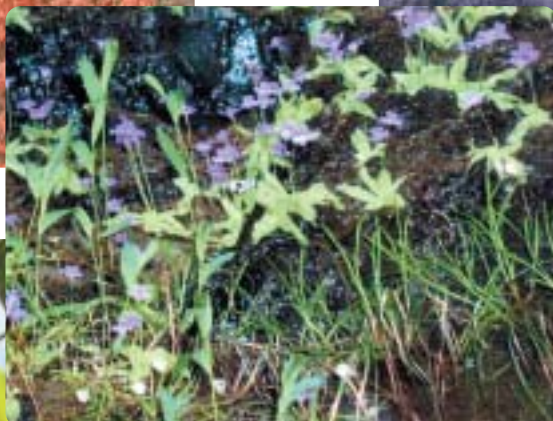
ムシトリスミレ (飯高管内)