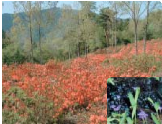
富士見ヶ原のツツジ (飯南管内)