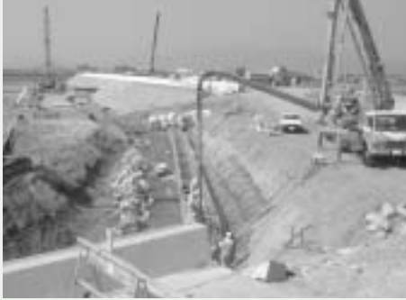
改修が進む海岸堤防工事（平成16年度）

答 しゅんせつもいろいろ県民局へお願いしている。三渡川1本のことなので、県の方に十分に要望をしていきたい。