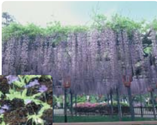
松阪公園の藤 (本庁管内)