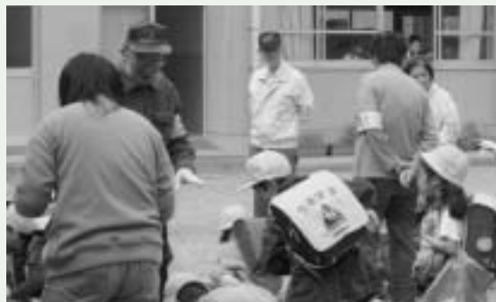
気をつけて帰ろうね(花岡小スクールサポーター)

松阪市でも、こういった事業を全校区に広げていっていただきたい。市長の重点政策である安全・安心について、弱者である児童には特に気をつけて進めていただきたい。