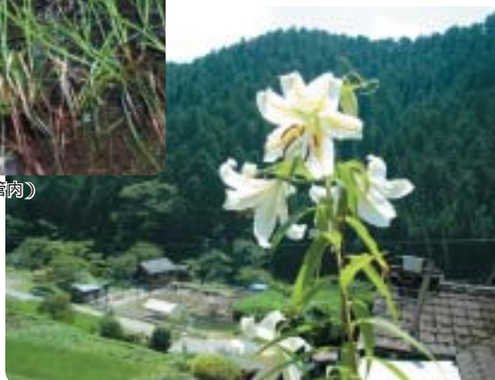
やまゆり (嬭野管内)