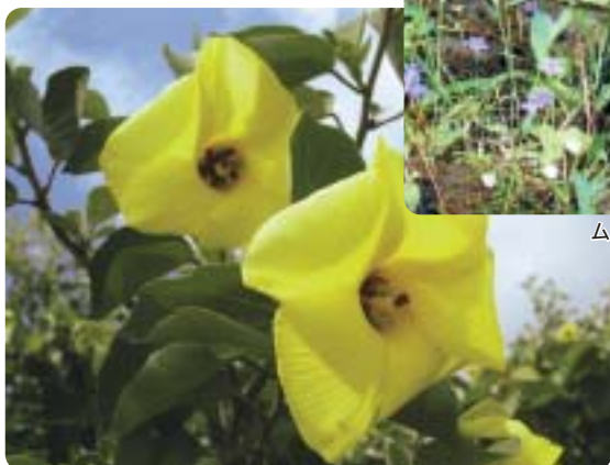
ハマボウ (三雲管内)