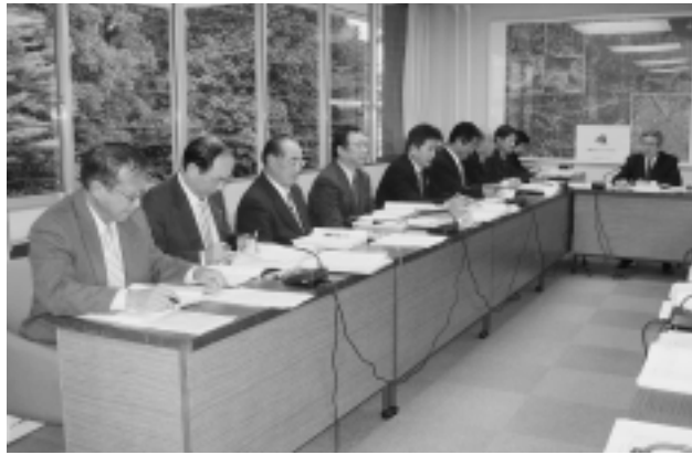
決算調査特別委員会の審査風景

いる中、この事業に対する要望も多く、補助を受けられないことが生じているため、この事業のなお一層の充実に取り組まれない。