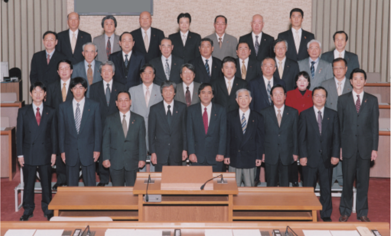
2008年を迎えて（市議会議場にて）