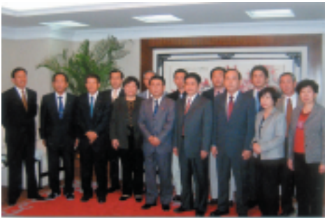
(左より) 許昌市議会と市政府を訪問

上海では1m 2 が250万円もするマンションも出現し、まさにバブル状態である。今年のオリンピックと2010年に予定されている上海万博が終わった後、中国経済がどうなるか注目される。日本と中国は隣国としての結びつきが深い、国交正常化からわずか35年、中国は未知の魅力と大きな可能性を秘めた大国である。今後中国がアジアと世界に与える影響が大きくなっていくことは確実である。わが国の隣国として今後も、友好な関係を続けていきたいものである。今回限られた日程であったが、中国の人達との交流の中で、一部であるが中国の姿を直接見ることができたのはありがたく、今回の訪中に当たり視察を受け入れていただいた中国の皆様方、ご支援ご指導いただいた方々にお礼申し上げます。