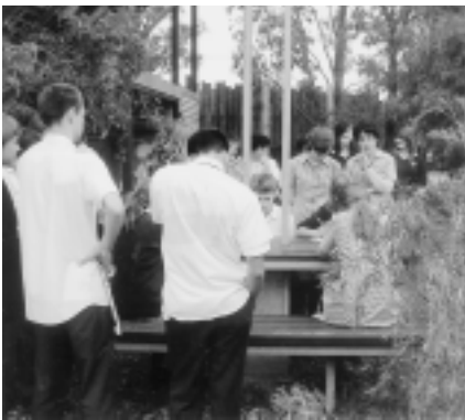
セレス環境パークで研修を受ける学生達

環境パークができてから25周年、スタッフは約150名でフルタイムで60〜70名が働いている。広さは約4haでピオトープ、菜園、果樹園、小動物もいる。民族的な小屋が建てられ、そこでは、民族太鼓のけいこをしている。このパークへの来場者は年間30万人、その内の約7万人が学生である。入場料1人15ドル、年間70万ドルの収入があり、小規模ビジネスである。教育面、他、地元雇用の場となっている。また、フェスティバルも開催される。有機栽培プロジェクトもあり、毎週土曜日に野菜が販売されている。地元市民に喜ばれ年間100万ドルの利益がある。この日も200人ぐらの学生が20〜30人のグループに分かれ、あちらこちらで教員より指導を受けていた。環境教育が徹底して行われているのを目の当たりにした。ここは非営利法人である。