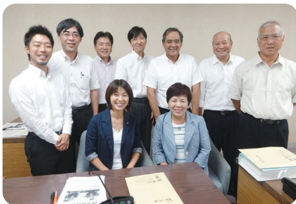
広報広聴委員会委員