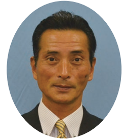
山 本 節 議員