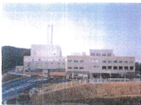
クリーンセンター