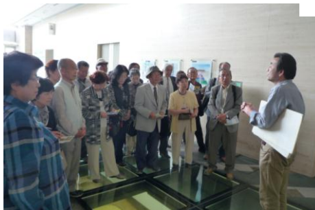
大阪歴史博物館で説明を受ける参加者