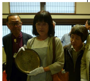
重さ確かめる参加者