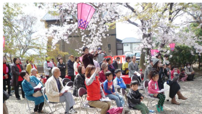
満開の桜の元で、多くの方が来られました。