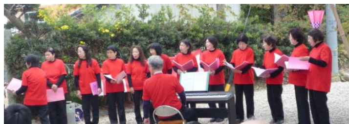
『クレッシェンドみくも』による合唱

の演奏、地元の合唱団（クレッシェンドみくも）による春の歌の合唱、団子や綿菓子、お菓子など舞いもあり、近所の家族連れぎわいました。