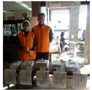
記念館入口で書籍の販売