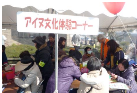
アイヌ文化体験コーナー