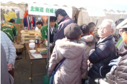
音威子府村前の行列