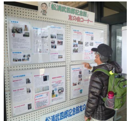
活動のパネル展示(記念館入口)