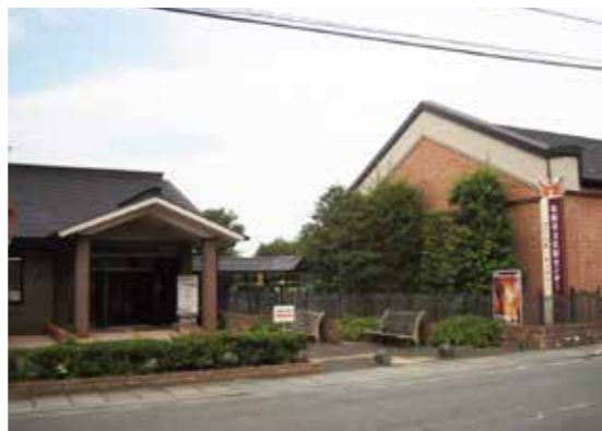
現在の松阪市文化財センター外観

設立 20 周年を迎え、今までよりさらに多くの皆さんに利用していただけるように、来年も松阪市文化財センター職員一同頑張ります！（担当）