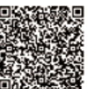
バーコード読み取り (文化財センター情報)

12月の休館日は、7日（月）、14日（月）、21日（月）、24日（木）、28日（月）～31日（木）です。開館時間は9:00～17:00です。