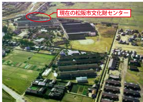
現在の松阪市文化財センター

さて、平成 28 年は松阪市文化財センターが設立してから 20 年を迎える年となります。松阪市文化財センターは、大正 12 年に建設された旧カネボウ綿糸松阪工場の綿糸倉庫を保存・活用することを目的に、綿糸倉庫部分の改修・補強を行い、さらに隣接地に管理棟を新築して、平成 8 年 10 月に開館しました。これにより、ギャラリーとして利用していただいたり、発掘調査で出土した遺物の収蔵・展示を行うことで、多くの方に発掘調査の成果を見ていただけるようになりました。平成 14 年 6 月には、綿糸倉庫部分が貴重な近代遺産として評価され、国の登録有形文化財となりました。現在では、平成 15 年に「はにわ館」が開館したことで、綿糸倉庫部分は市民ギャラリーとして利用していただいています。