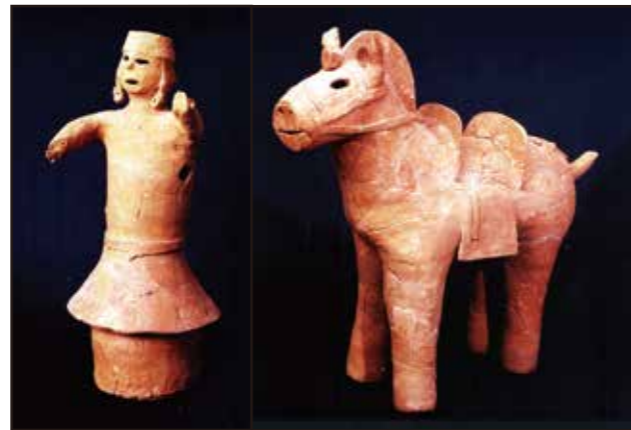
馬子と馬の埴輪（常光坊谷4号墳出土）

現在、はにわ館第2展示室では市内の埴輪を集めた夏季企画展「続 まつさかの埴輪」を開催しています。動物の埴輪のほかにも30点以上の埴輪を展示しています。是非まつさかの埴輪を見に、はにわ館へお越しください。(担当)