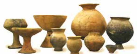
文化財センターに保管されている土器の一部

気温も暖かくなってきて外に出やすくなったこの時期に市内の文化財巡りをしてみてはいかがでしょうか。もちろん松阪市文化財センターにも遊びに来てくださいね！ご来館をお待ちしております。(担当)