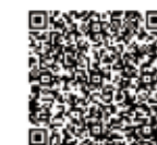
バーコード読み取り (文化財センター情報)