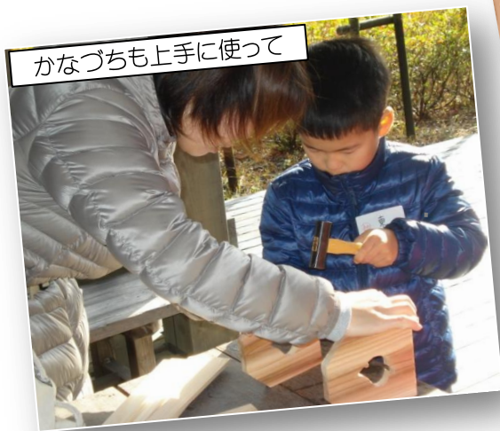
かなづちも上手に使って