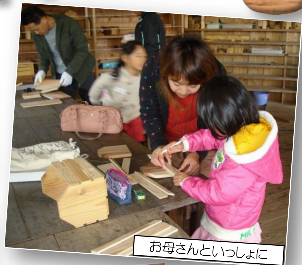
お母さんと一緒に