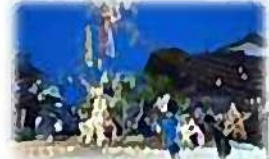
前年の七夕まつり