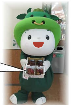
松阪市マスコットキャラクター「ちゅちゅも」