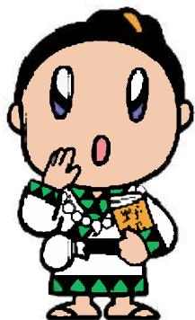
武四郎まつりマスコットキャラクター たけちゃん

松阪市からは「ちゃちゃも」や「モー太郎」も一緒に参加するんだ。みんなで頑張ってくるから、ぜひ、みなさんも応援してください！