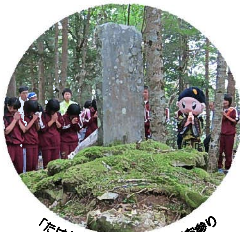
「たけちゃん」もいっしょにお参り

今年は、例年の一泊二日ではなく日帰りでの登山でしたが、三雲中学校・小野江小学校の児童生徒や保護者、関係者が登山に参加したほか、武四郎まつりマスコットキャラクターの「たけちゃん」も初めて武四郎翁の分骨碑にお参りするなど、武四郎翁の偉大な功績を偲ぶとともに、大台ヶ原の美しい自然を満喫してきました。