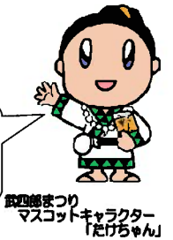
武四郎まつりマスコットキャラクター「たけちゃん」