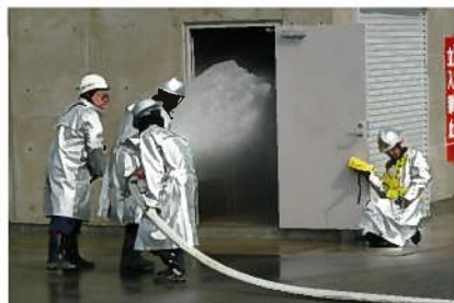
▼建物内への放水訓練