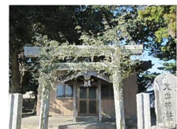
八雲神社（西肥留町）