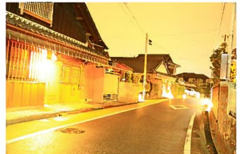
写真は、昨年12月31日の仮点灯の時のものです。

松阪市ホームページ「幸せKIZUNA ブログ」に、地域の魅力発信！と題して、旧伊勢（参宮）街道の記事を掲載しています。ぜひご覧ください。