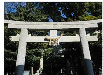
小野江神社（南小野江）