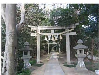
米ノ庄神社（市場庄町）