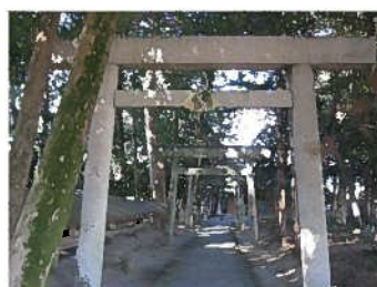
宇気比神社（肥留町）