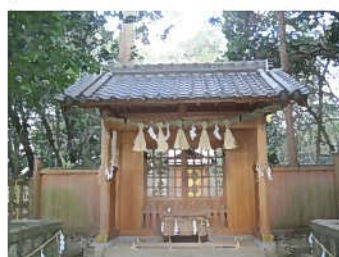
米ノ庄神社（市場庄町）