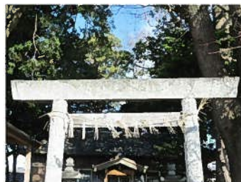
須賀神社（東小野江）