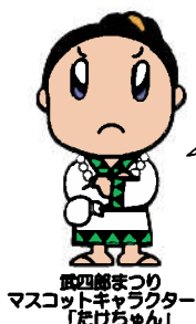
武四郎まつり マスコットキャラクター 「たけちゃん」

最近、三雲管内でも道路や、個人の鉄製側溝ふたの盗難が起っています。発見されたかたは、最寄の駐在所、三雲振興局 地域整備課 (電話56-7913) までご連絡ください。