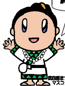
武四郎まつり マスコットキャラクター 「たけちゃん」

振興局だより「みくも」は、松阪市のホームページにてフルカラーでご覧いただくことができます!