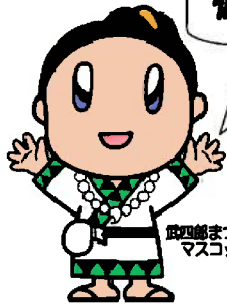
四前まつり マスコットキャラクター 「だけちゃん」