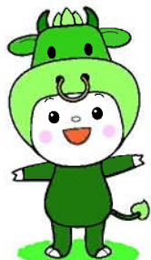
松阪市 振興局だより キャラクター 「ちやちやも」