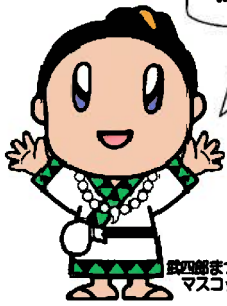
政令まつり マスコットキャラクター 「たけちゃん」

振興局だより「みくも」は、松阪市のホームページにてフルカラーでご覧いただくことができます!