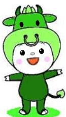
政令まつり マスコットキャラクター 「ちゃちゃも」