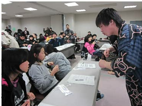
ムックリ演奏体験

講師には今年の武四郎まつりにご出演いただいた「チーム ニカオプ」の皆さんを迎え、アイヌ文化講演会、アイヌ語のカルタとり、民族楽器“ムックリ”の演奏体験やアイヌ古式舞踊の踊り体験が行われ、参加した皆さんからは笑顔があふれていました。