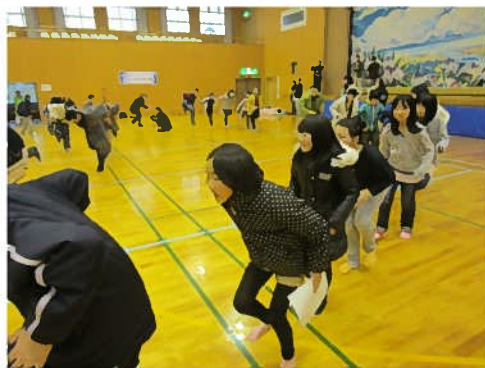
アイヌ古式舞踊体験