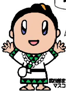
松阪まつりマスコットキャラクター「たけちゃん」