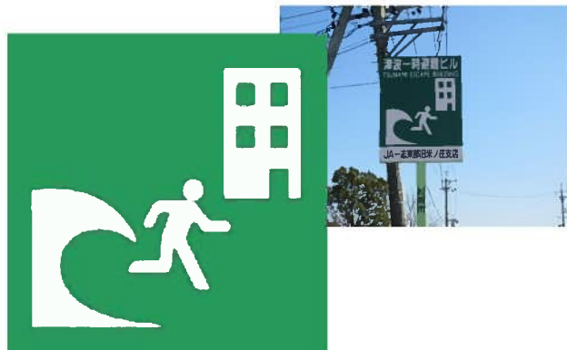
このマークが目印です

災害はいつやってくるかわかりません。何よりも、日ごろからの備えが命を守ることにつながります。大地震や津波が発生したときに、パニックに陥らないためにも、どこに避難場所や津波一時避難ビルがあるかなど、避難方法を事前に確認し備えておくことが大切です。