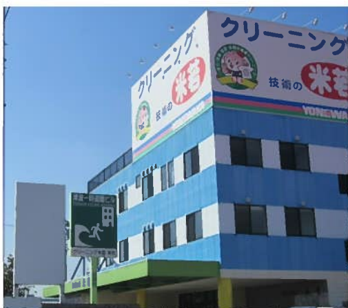
クリーニング米若 本社