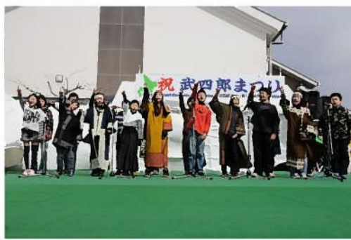
「武四郎守り隊」による学習発表会

【問い合わせ 武四郎まつり実行委員会事務局（三雲振興局 地域振興課） 電話 56-7927】