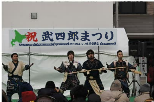
「チーム・ニカオプ」の皆さんによる アイヌ古式舞踊

また、会場では東日本大震災復興支援グッズの販売や、まつりマスコットの「たけちゃん」とのじゃんけん大会、（社）北海道中小企業家同友会釧路支部、三重県中小企業家同友会の協力により、特別出展として北海道釧路産のカニと松阪産の野菜・味噌を使った「武四郎汁」限定200杯が無料でふるまわれるなど、盛りだくさんの催しで会場は大いににぎわいました。