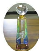
手渡された推奨像