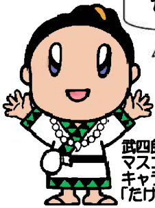
武四郎まつり マスコット キャラクター 「たけちゃん」