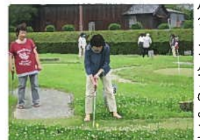
パターゴルフのようす