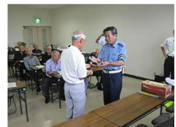
伝達式のようす (小野江コミュニティセンター)