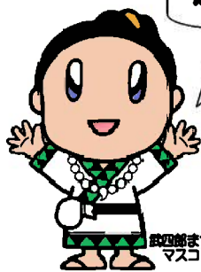
四雲まつり マスコットキャラクター 「だけちゃん」