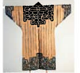
アットウシ （樹の皮で作った着物）