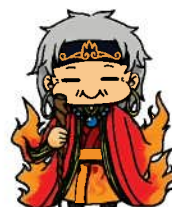
ウレシパクラブ マスコットキャラクター 「うれしばあ」