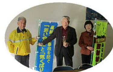
天白松寿会の皆さん