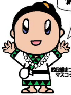
四條まつり マスコットキャラクター 「みくもちゃん」