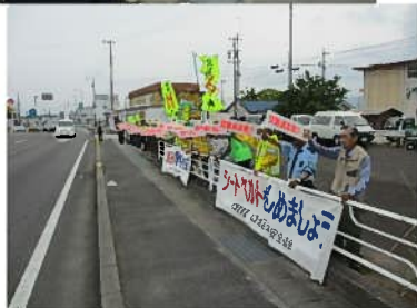
中道町で行われたミルミルウェーブの様子