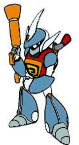
松阪市防災キャラクター マツサカン