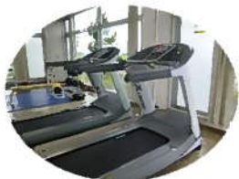
リニューアルしたランニングマシン

ハートフルみくもスポーツ文化センターには、アスレチックジムの施設があり、さまざまな機器をご利用いただけます。その中で、ランニングマシン・振動マシン・ジョーバ・腹筋台の4機器を7月にリニューアルしました。