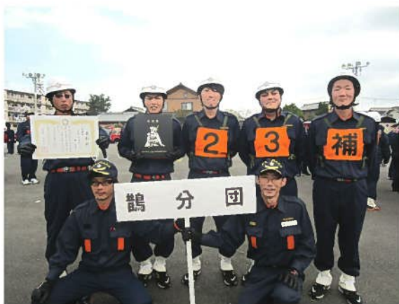
準優勝に輝いた鶺鴒分団の皆さん

鶺鴒分団の選手たちはこの日に向けて厳しい訓練を重ね、動きの正確さと敏しいう性を向上させ、本番では持ち前の集中