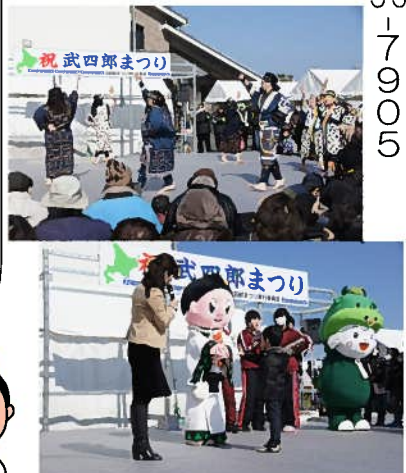
昨年のまつりのようす

問 武四郎まつり実行委員会事務局 (三雲振興局 地域振興課内) ☎ 56-7905