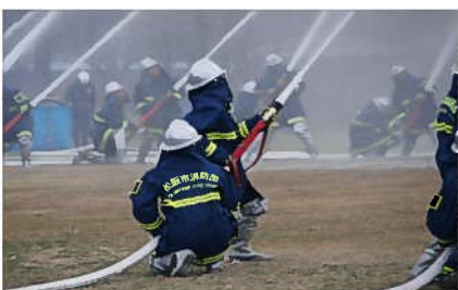
放水訓練のようす