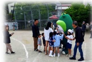
「ちゃちゃも」が応援に来てくれました