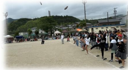
スリッパ飛ばし（新記録が出ました！）