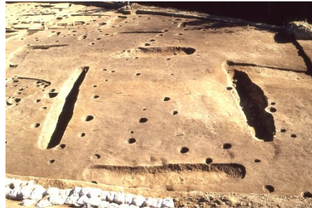
方形周溝墓7の写真

中村川河川改修、県道建設、区画整理事業により1985 年から1996年の間に何度か発掘調査が行われました。調 査では主に弥生時代の方形周溝墓と呼ばれるお墓が42基 も見つか、南北約300mにわたって整然と配置されてい たことが分かっています。溝から見つかった土器から弥生 時代中期（今から約2200年前）から後期（今から約1800 年前）までのお墓だったことが分かっています。