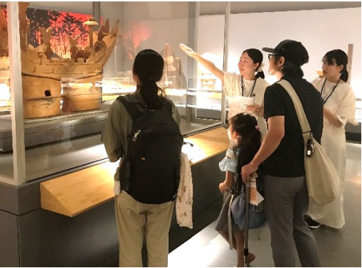
昨年度のガイドの様子