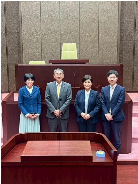
姫路市議会 議場にて

姫路城マラソンの経済波及効果は約 11 億 7,000 万円(2025 年大会)で、みえ松阪マラソンの方が高い。一方で、松阪では地元経済への効果が限定的であると感じられるため批判が絶えないのではないか。松阪市では文化施設と商店街との動線企画も成功しているとは言い難いが、マラソン大会と商店街との連携も協定や助成金などの工夫でさらに強化することが大切との認識を改めて得た視察であった。まちが賑わいを見せれば私設エイドなどが増えることで、一層賑わいの創出に華を添えることができるであろう。