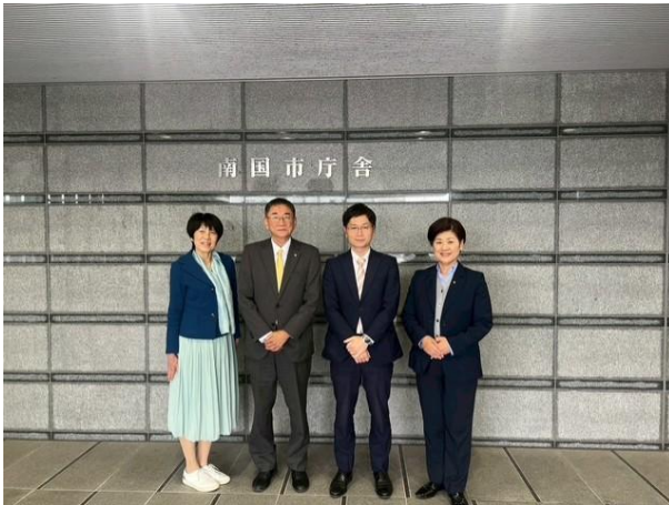
南国市役所玄関前にて