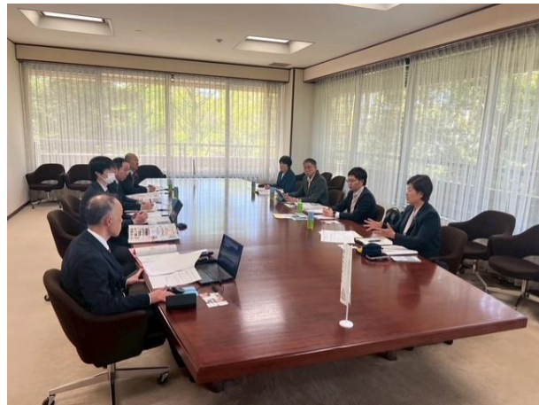
姫路市役所会議室にて